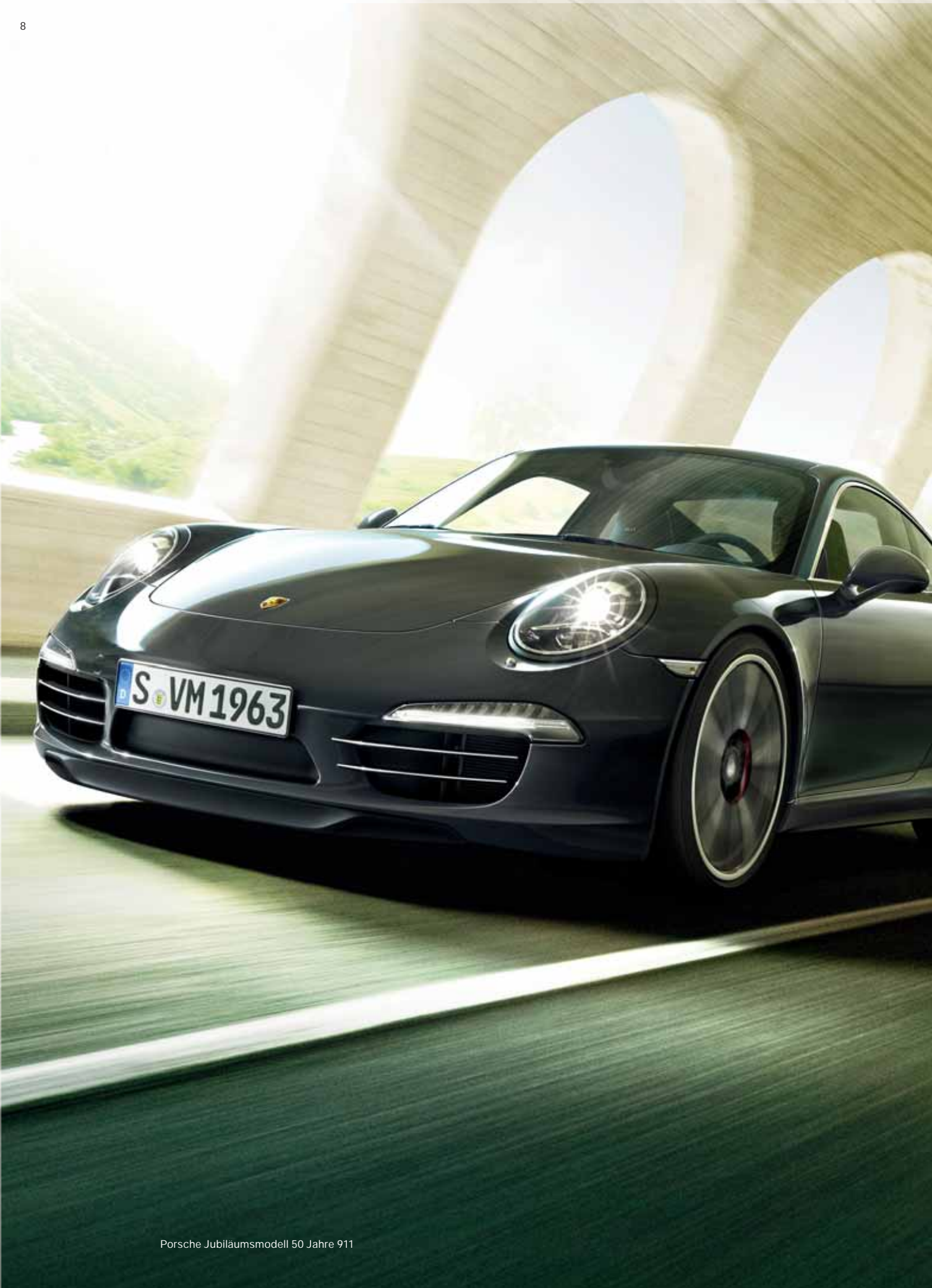
Porsche Jubiläumsmodell 50 Jahre 911