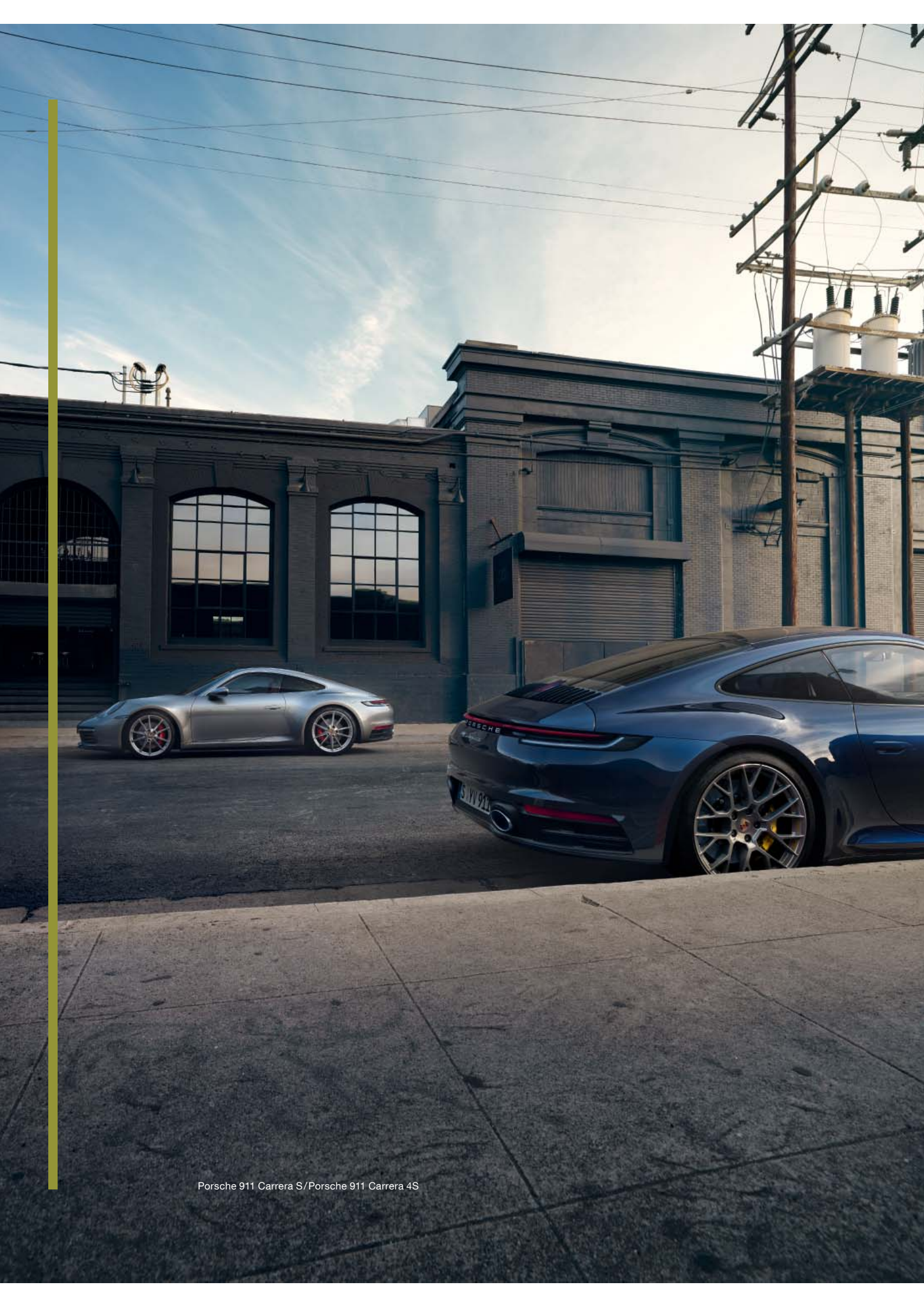
Porsche 911 Carrera S/Porsche 911 Carrera 4S